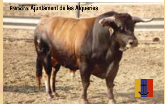
DIJOUS, 11 D'OCTUBRE Bou de LOS RONCELES, nom Retrasado, número 19, guarisme 4, color "castaño claro".