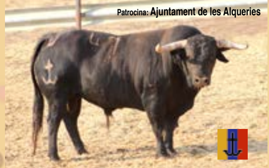
DILLUNS, 8 D'OCTUBRE Bou de LOS RONCELES, nom Tunecino, número 47, guarisme 4, color "negro mulato poco meano".