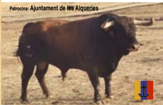
DIJOUS, 11 D'OCTUBRE Bou de LOS RONCELES, nom Domino, número 28, guarisme 4, color "castaño".