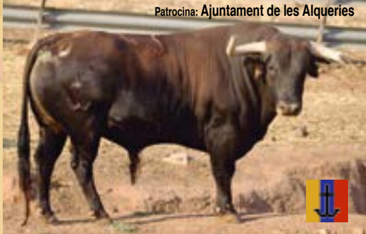
DILLUNS, 8 D'OCTUBRE Bou de LOS RONCELES, nom Gavioto, número 45, guarisme 4, color "castaño listón".