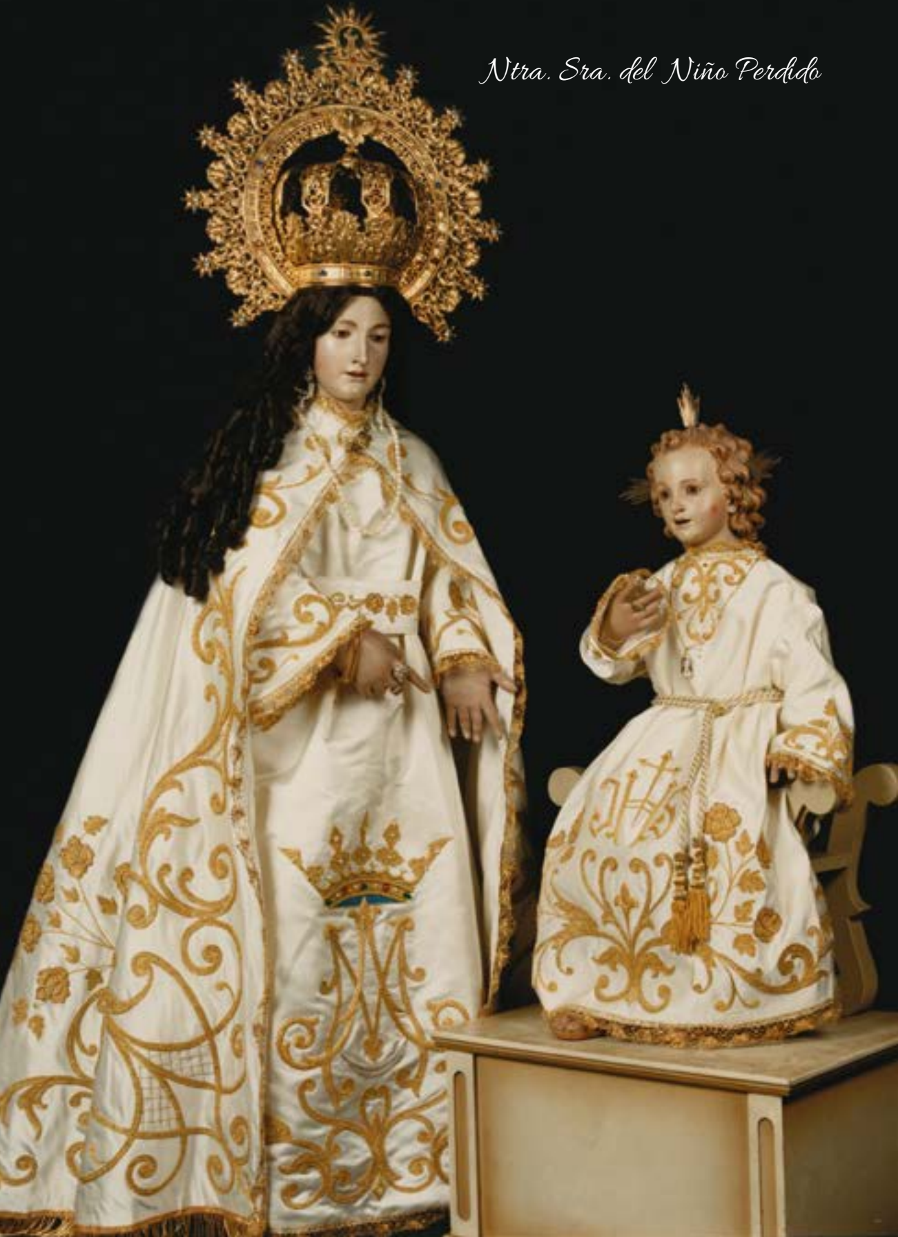
Ntra. Sra. del Niño Perdido