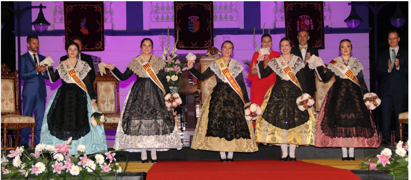
Acte de presentació de la reina de festes i les dames de la cort d'honor

Per primera vegada s'ha celebrat dos bous en corda i un campionat de futbolí en aquestes festes