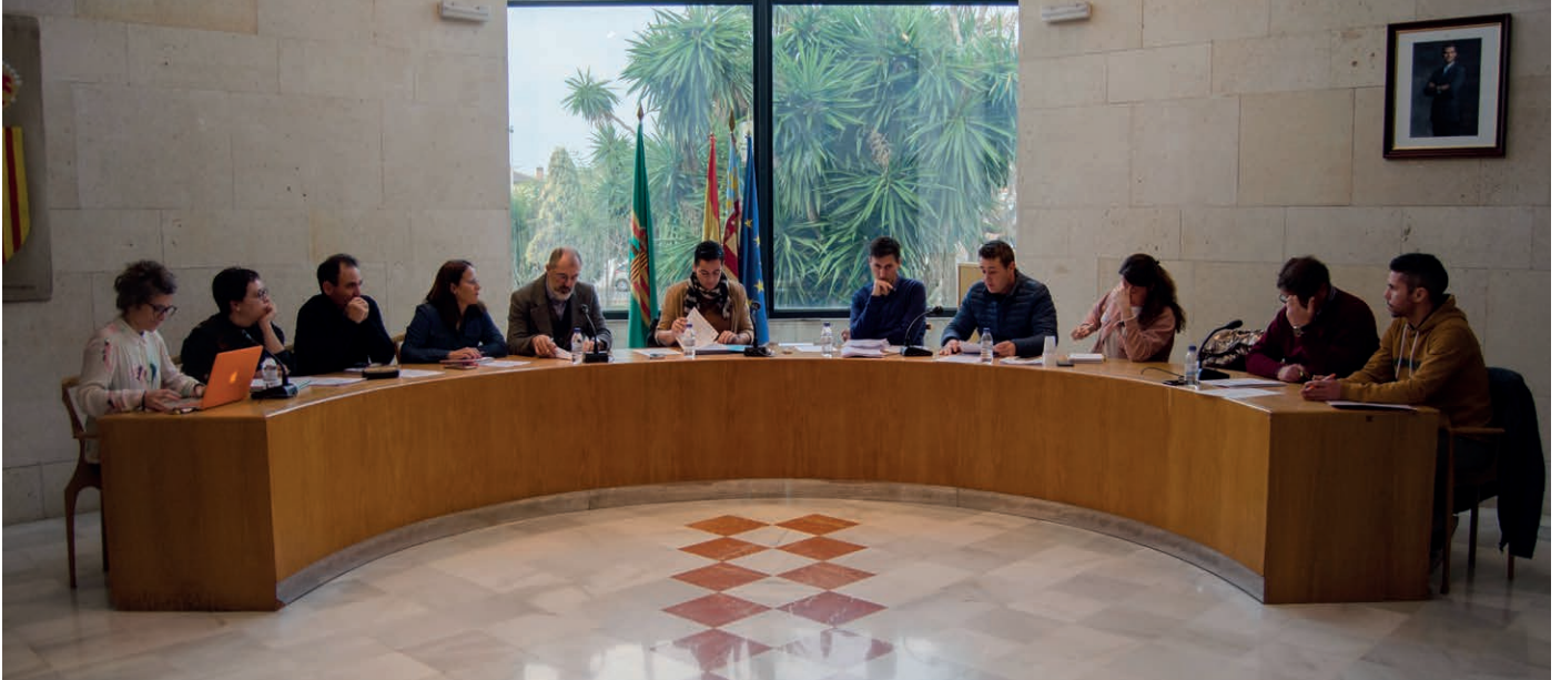
Ple del 13 de febrer del 2020

El ple dona el vistiplau als comptes que augmenten la col·laboració amb la ciutadania a través de les subvencions a les associacions i comencen a fer front als expedients urbanístics pendents