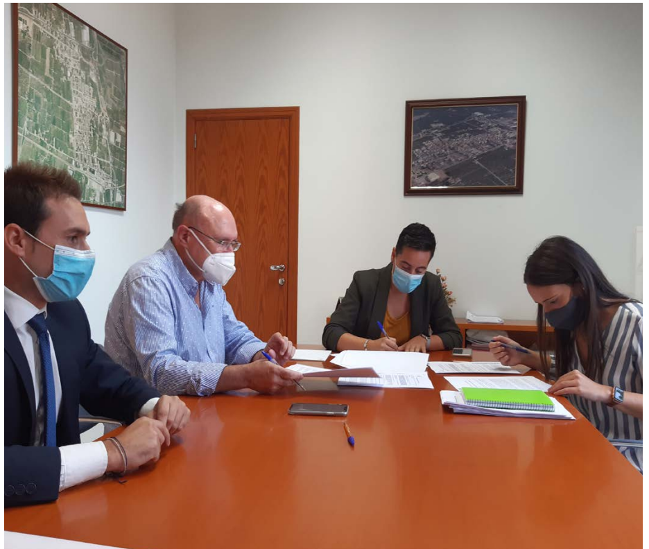
Reunió amb els representants legals per a assolir l'acord.