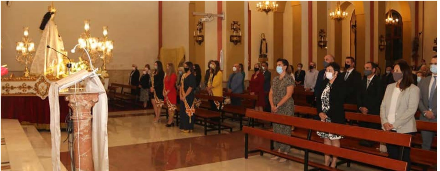
Imatge de la celebració de la missa amb totes les mesures de seguretat sanitària.

La regidoria de Festes va prendre aquesta decisió per evitar més contagis i seguir garantit la seguretat de tota la ciutadania en un moment d'alerta sanitària