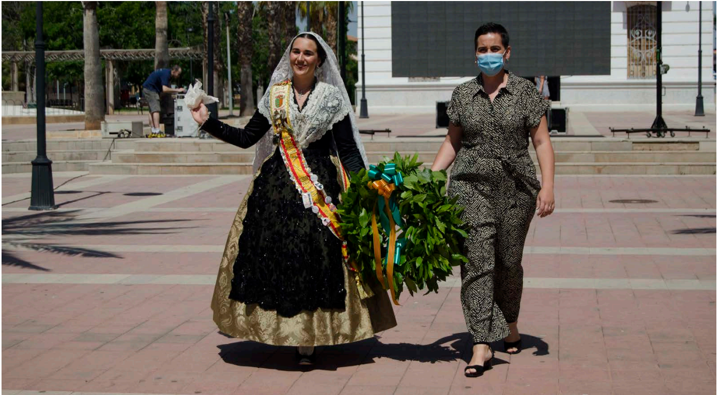
Acte institucional d'ofrena al "Monòlit"

Les Festes de la Segregació es van suspendre a l'abril però el consistori va organitzar activitats per a gaudir des de casa i commemorar l'aniversari de manera segura