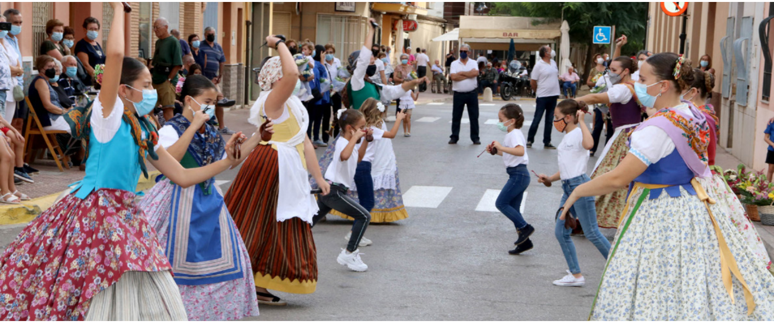
Celebració de l'ofrena a la Mare de Déu del Niño Perdido

La programació ha inclòs un dia infantil, actes gastronòmics, musicals, taurins i religiosos com l'ofrena de flors tots adequats a la normativa sanitària