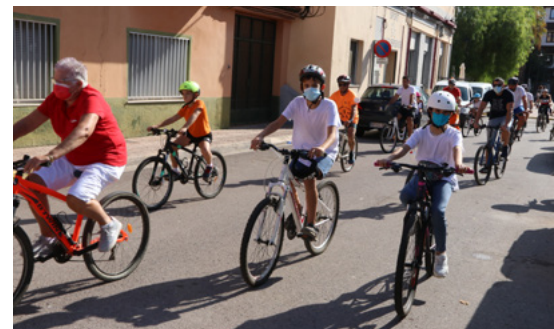
Volta en bicicleta