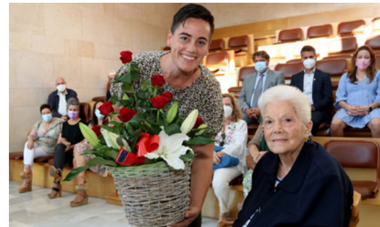
Homenatge a la dona de més edat