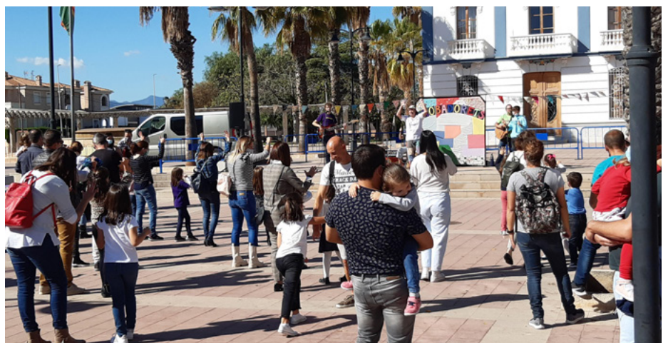
Actuació de Trobadorets a la Plaça Major

el 22 i 23 d'octubre de 2022. Les xiquetes i xiquets s'ho han passat tan bé que hem decidit organitzar de nou el festival gratuït perquè puguen divertir-se amb un cap de setmana amb activitats pensades per als més menuts".