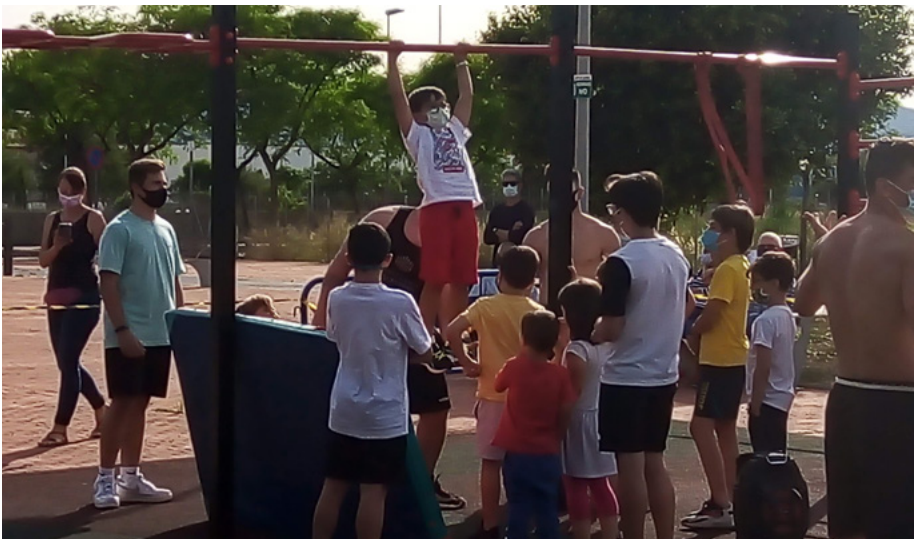
Joves i xiquetes i xiquets aprenen al taller pràctic

El consistori ha organitzat activitats per a ensenyar el correcte funcionament de les instal·lacions