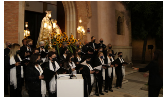
Serenata a la Verge del Niño Perdido