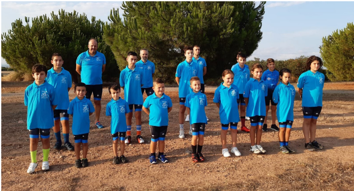
Alumnes de l'escola Sport Ciclista Alqueriense

En el seu primer any ha organitzat dos carreres a les Alqueries i iniciarà nova temporada a febrer