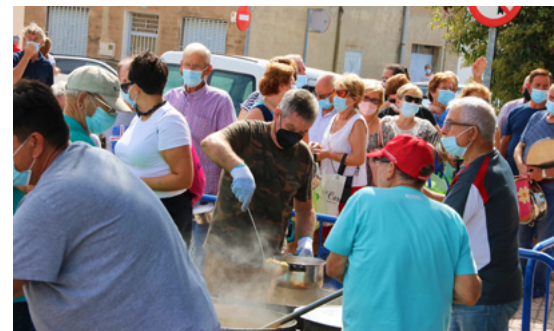
Dinar de calderes