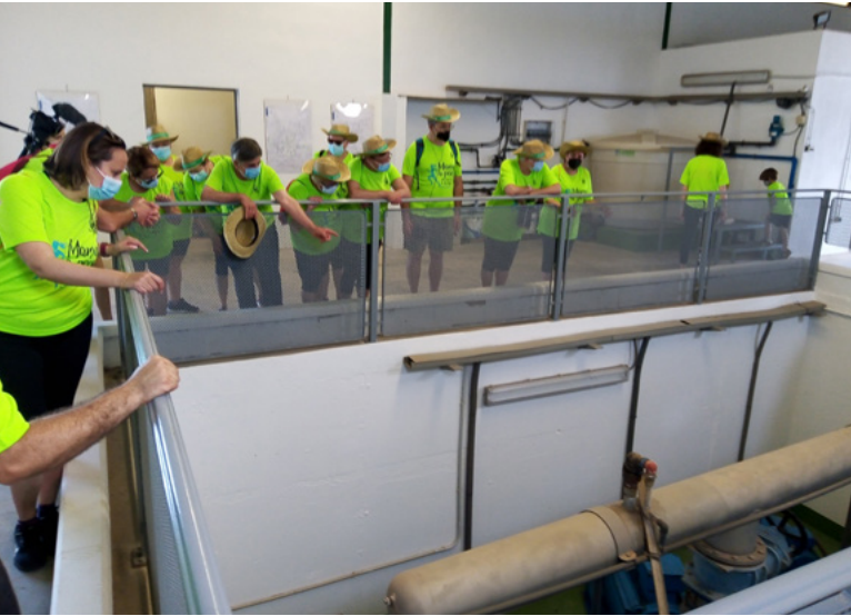
Ruta pels pous de reg de les Alqueries

Les dos rutes es poden consultar en lesalqueriespedia.com perquè qualsevol persona pugui fer-les