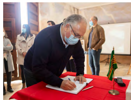
Director general d'Administració Local signa el llibre de visites