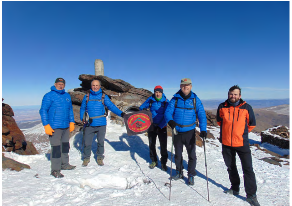
Pico Mulhacén (3.479 m)

Al novembre van viatjar per diferents llocs de les muntanyes alcantines. En primer lloc, van ascendir al Puig Campana (1.410 m) que té vistes a Benidorm. Després, van decidir pujar al Penyal d'Ifac situat a Calp. Van completar la seua ruta amb la visita al paratge de les Fonts d'Algar, un conjunt de cascades