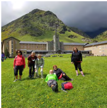
Vall de Núria (Pirineos Catalanes)

Per últim, el pic que puguen cada any és el d'Espadà, una tradició que acaba amb el menjar de Nadal. El centre d'excursionista les Alqueries ha recorregut tots els pics que ha pogut i han complit el seu repte més difícil, pujar el pic Mulhacén. Amb esta activitat frenètica han demostrat que amb esforç tot s'aconsegueix.