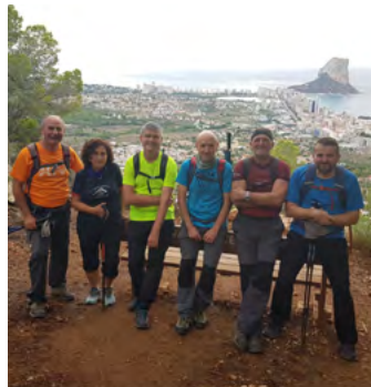
Serra d'Oltà (Penyal d'Ifach, al fondo)