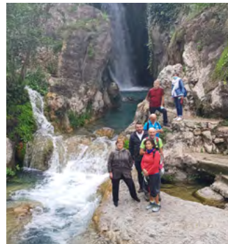
Les Fonts de l'Algar (Callosa d'en Sarrià, Alacant)