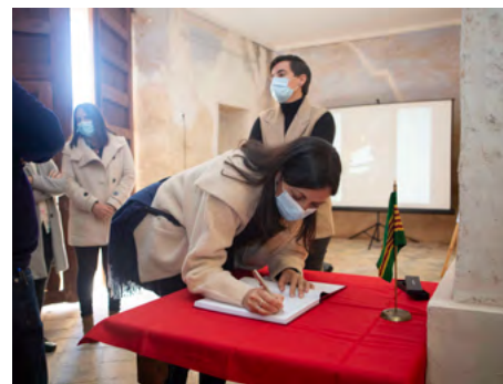
Directora territorial de Presidència de Castelló signa el llibre de visites

La Vella Església del Replà és un conjunt arquitectònic del segle XIX, que s'erigeix sobre l'antiga alqueria Prop Bonretorn, de la qual existeixen referències des del segle XVI. És un oratori construït en 1852 pels propis habitants del lloc, que es va convertir en el primer espai públic de reunió del poble.