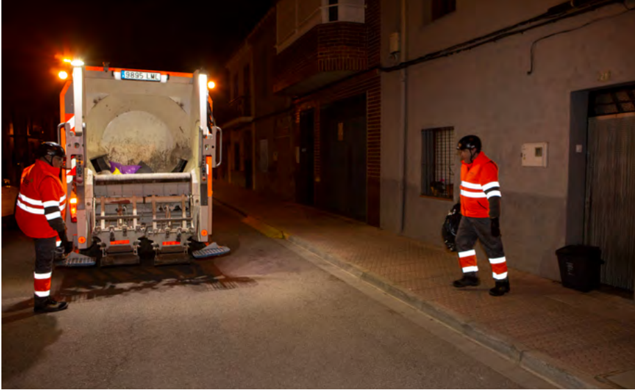
Repartiment de poals durant la Fira de Nadal del comerç local

L'objectiu és arribar al 55% de recollida selectiva en 2025 com marca la normativa estatal i evitar així pagar les sancions que s'aniran imposant en ixte moment