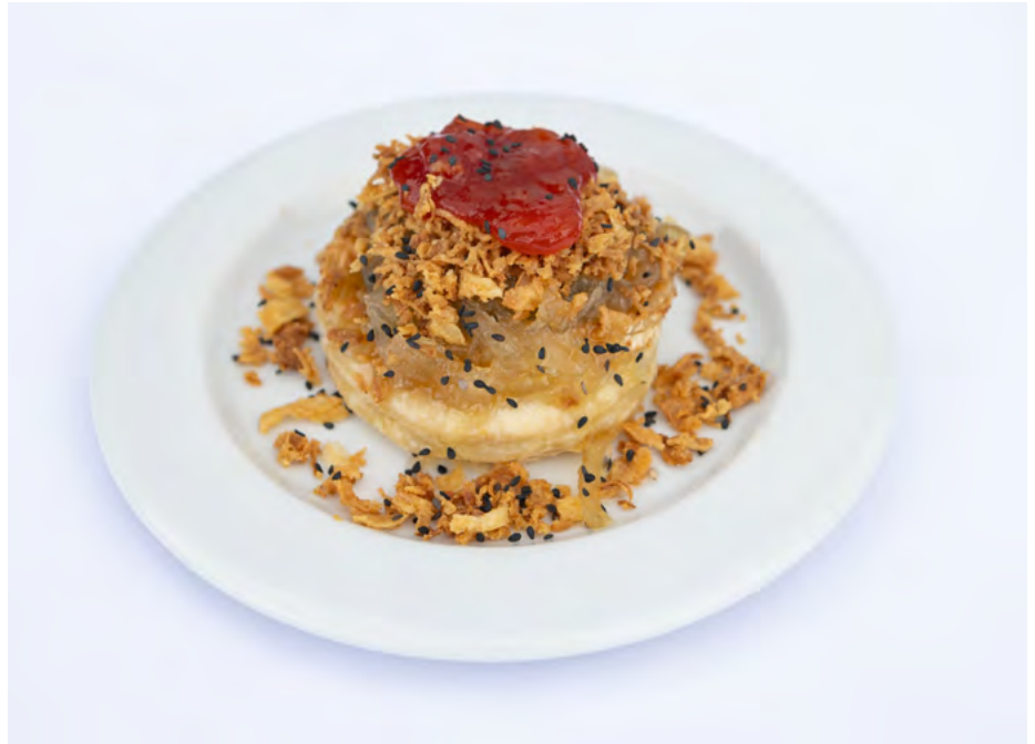
Tapa guanyadora de l'Hotel Plana Parc en la V Ruta de la Tapa

Del 3 al 19 de juny s'ha pogut tastar les huit creacions per tres euros o quatre amb una beguda. Esta ha sigut la primera edició