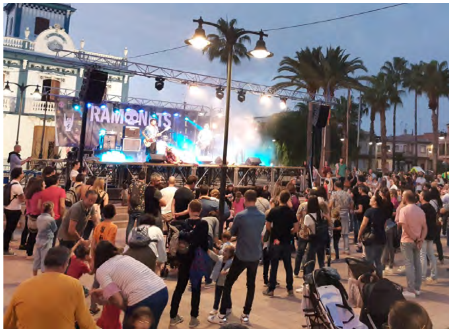
Actuació Flipa! de Ramonets a la Plaça Major

El festival familiar va celebrar la segona edició amb actuacions de Ramonets, Xa Teatre i Twister Peli