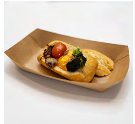
Tapa de SOS comida para llevar