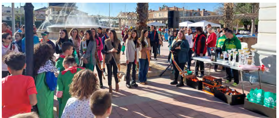
Entrega de premis Sant Silvestre

Tampoc ha faltat la recepció de les cartes als emissaris reials, la decoració de l'arbre de Nadal, els festivals nadalencs o Celebrem el solstici al Casal Jove amb eixides, excursi-