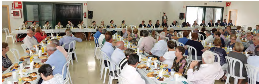
Vi d'honor tercera edat