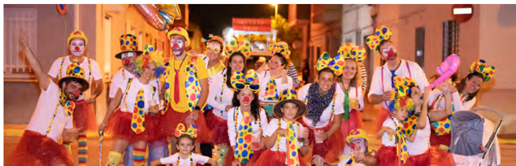
Cavalcada de disfresses