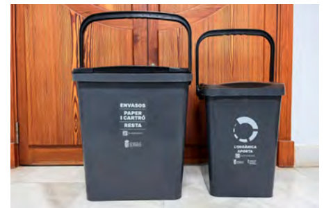
Poals per a traure les fraccions de residus al carrer

Els poals s'hauran de retirar de la via pública abans de les 9 hores del dia següent. Per a les persones que no puguen complir amb l'horari, hi haurà dos àrees d'emergència permanents. Una estarà situada al polígon Ull Fondo i altra al recinte del Mercat. Per a accedir, s'utilitzarà la targeta del Consorci C3/V1, que ja es fa servir a l'ecoparc mòbil. Este últim continuarà funcionant com a fins ara i la recollida de voluminosos actual augmentarà la seua freqüència i en lloc d'una vegada al mes, se farà cada dos setmanes.