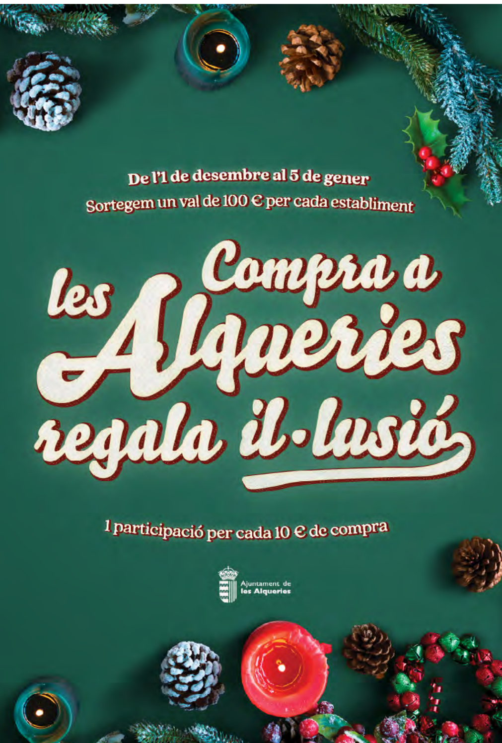
Cartell de la campanya de Nadal en 2022

La campanya premia a qui va comprar en la localitat des de l'1 de desembre fins al 5 de gener, a més de la cinquena edició de la Fira de Nadal