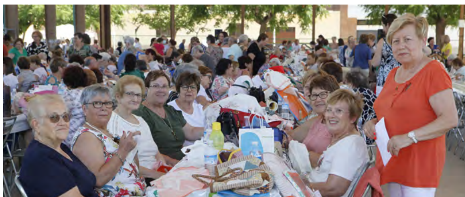
XVI trobada de boixeteres

La visita comentada en esta ocasió ha sigut el pany del Picapedrer i el pany dels Paus. A més de la presentació de l'article De Cap de Terme a les Alqueries en la restaurada església vella del Replà.