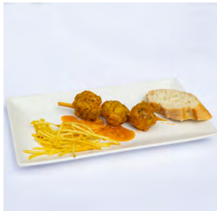
Tapa de Frankfurt Bar El Coco's

després de la pandèmia, ja que no se celebrava des de 2019 on Saló Vives va guanyar amb Ravioli cruixent de corder de llet a la brasa de romer.