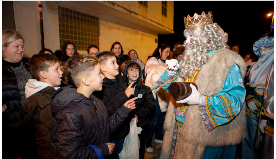
Cavalcada dels Reis d'Orient