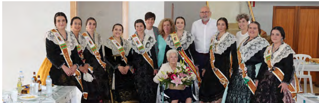
Homenatge a la dona de més edat

La regidora agràix la col·laboració de totes les associacions i penyes per a organitzar diferents actes de festes, "és una setmana per a disfrutar tots junts", a més de destacar "la bona acollida de les activitats programades per part de la ciutadania que demostra les ganes de passar-ho bé de tot el poble i dels visitants que hem rebut durant els deu dies de festes".