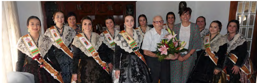
Homenatge a l'home de més edat