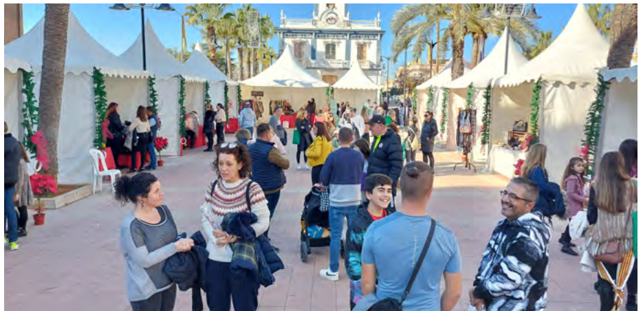
Fira de Nadal del comerç local