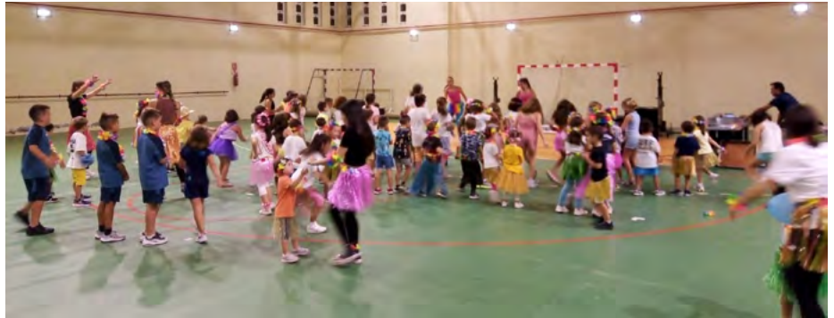
Disco clown en la festa hawaiana d'Oci nocturn

“L'activitat està pensada perquè les xiquetes i xiquets des dels 3 als 12 anys tinguen opcions de divertir-se en el mateix poble” detalla la regidora de Cultura, Noelia Albalate, i recorda que “l'accés a l'oci és un dret dels més menuts perquè és fonamental per al seu desenvolupament físic i psicològic”.