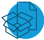
paper i cartró